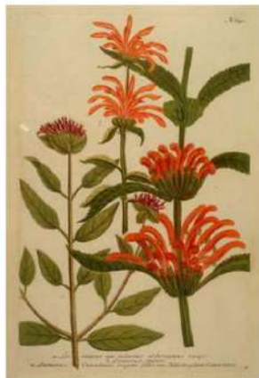
Door de stichting uitgegeven CD (2000) en ansichtkaart (2006)