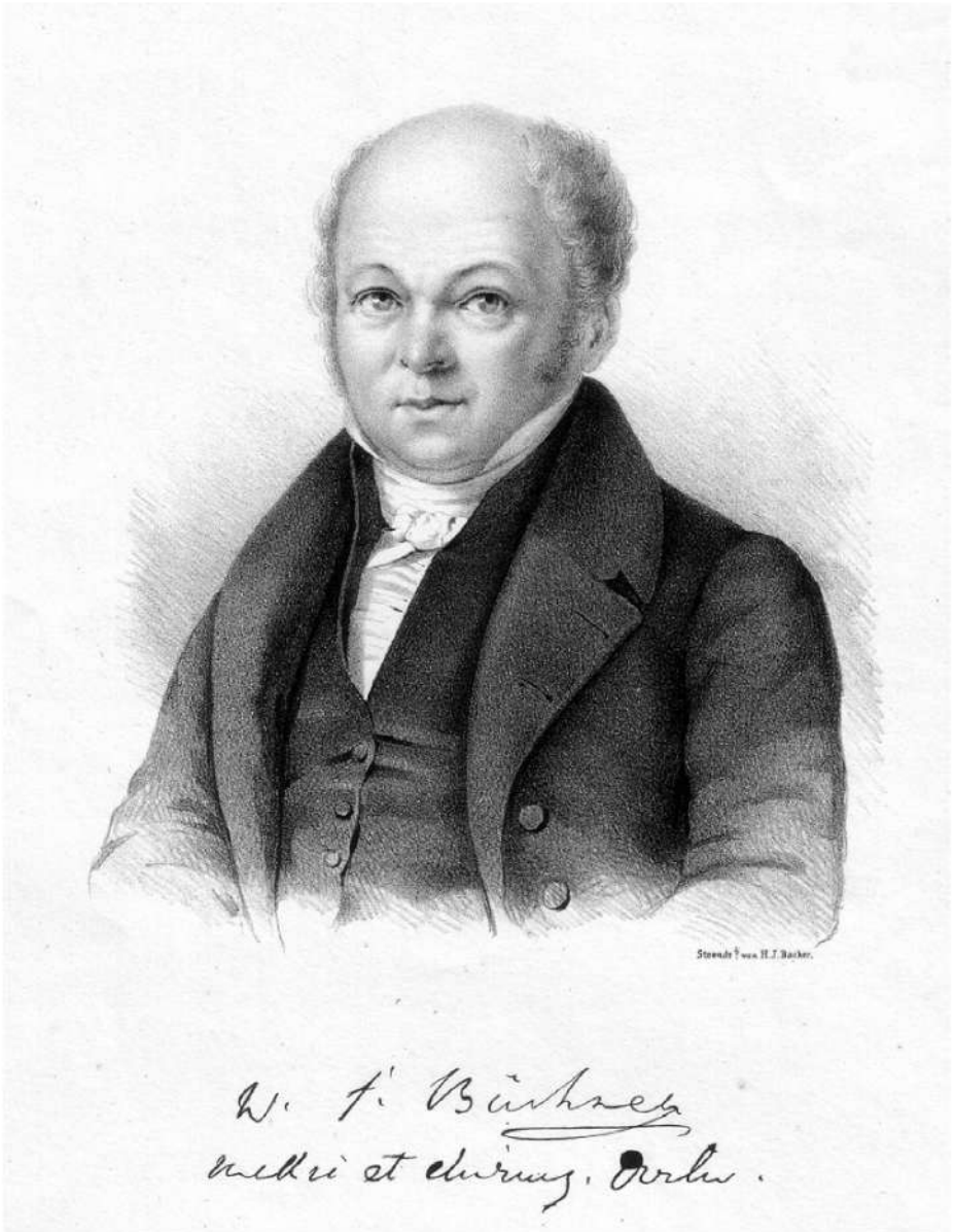
Gravure W.F. Büchner door H.J. Backer (lithograaf ca. 1840)