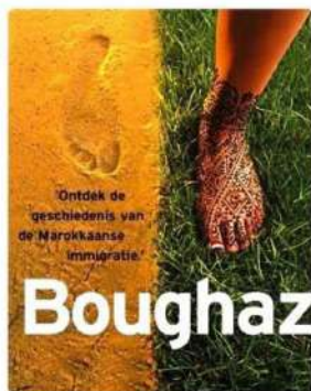
Steun aan de stichting Boughaz via het streekarchief, 2003

In 1994 werd besloten tot een steun van f1000 aan Die Goude voor een verzameling Bijdragen. 25 Steun daaraan werd ook verleend voor de uitgave van een bibliografie van Gouda. 26 (De Schatkamer zelf komt daarin voor onder nummer 4178, het eerdere Mededelingenblad van de stichting niet.) Via het streekarchief werd het project Boughaz ter vastlegging van de Marokkaanse migrantengeschiedenis gesteund.