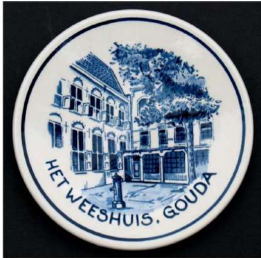
Bordje van het weeshuiscomplex van Royal Goedewaagen

Van de activiteiten van de stichting in 1987/1988 kan een grote boekverkoop via een catalogus worden gememoreerd. "Tenslotte dient met nadruk te worden vermeld, dat dank zij het automatiseringsfonds van de stichting de basis gelegd kon worden voor de automatisering bij de archiefdienst" , zo luidde het vervolg. 10 In deze periode overwoog het college van B & W van Gouda nog om een deel van het Librijebezit te verkopen, waarbij het stichtingsbestuur zich niet onbetuigd liet onder de succesvol protesterenden!