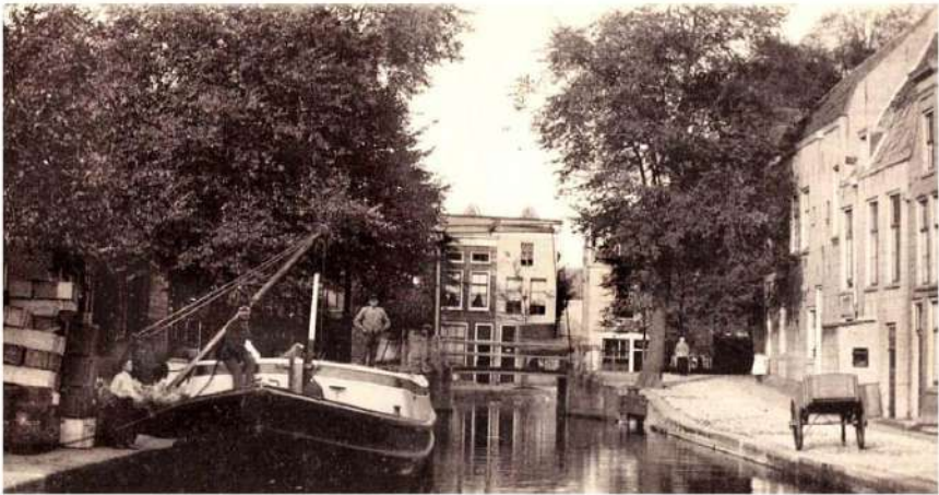
Het Nonnenwater (in de richting van de Gouwe) ca 1900