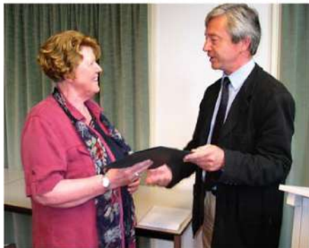
Uitreiking zesde Walvisprijs, 2004

W.A. Knoops, Na Goejanverwellesluis. Gouda tussen revolutie en contrarevolutie (juni - september 1787)