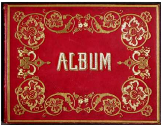
Omslag vriendenboek, aangelegd in 1847